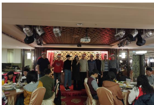
五都飯店晚餐-祈禱與祝福