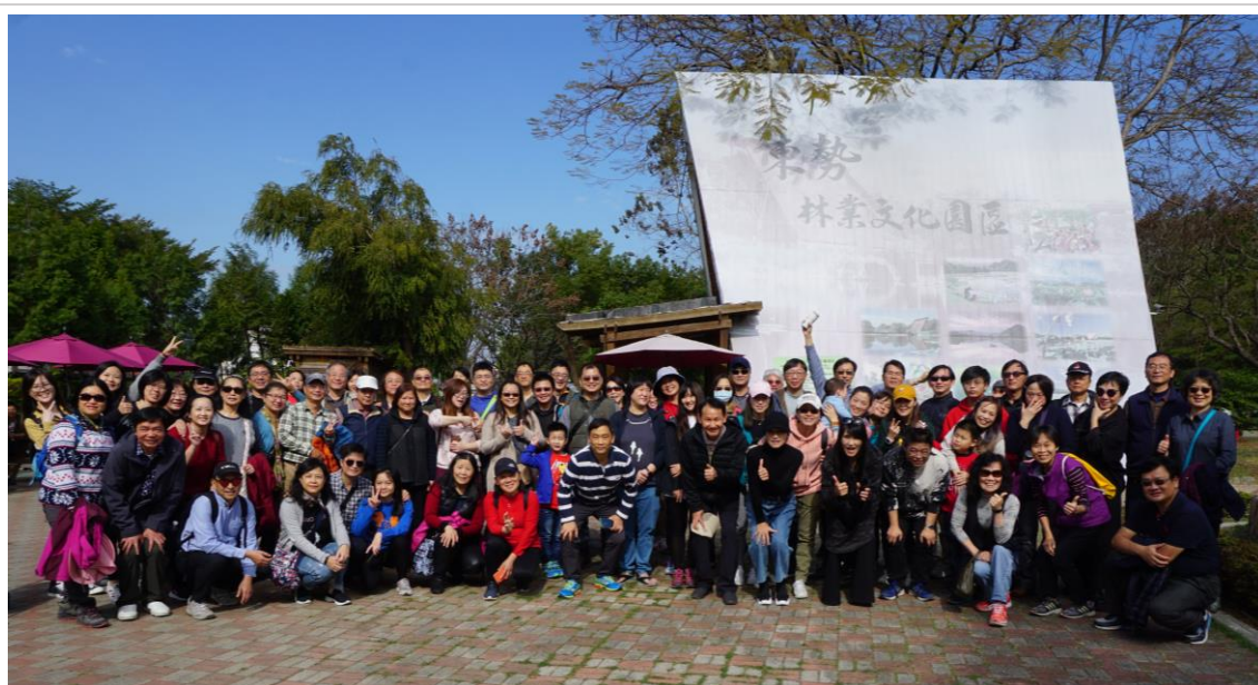
東勢林業文化園區大合照